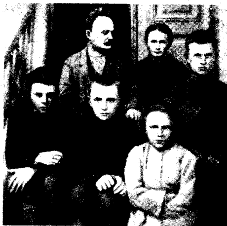
Іван Франко та його сім'я

Розглянь фотографію і дай відповіді на запитання: